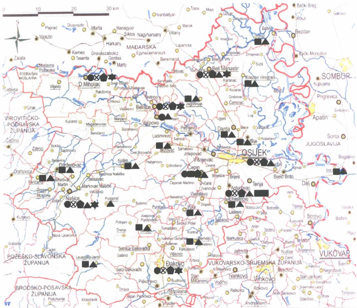
Slika F.2.1./1 - Planirani raspored objekata za gospodarenje otpadom u OBŽ