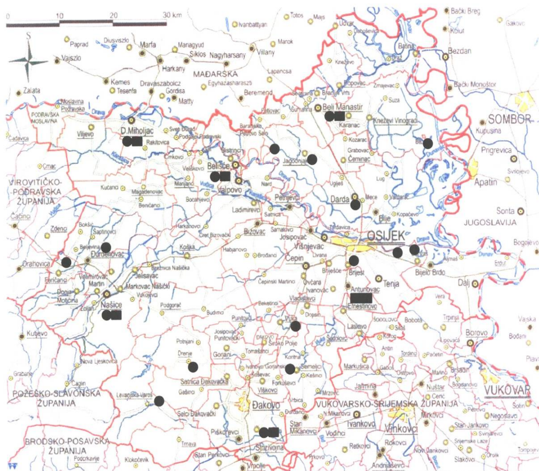
Slika C.1./1 Postojeće i planirano stanje odlagališta nakon zatvaranja postojećih odlagališta komunalnog otpada