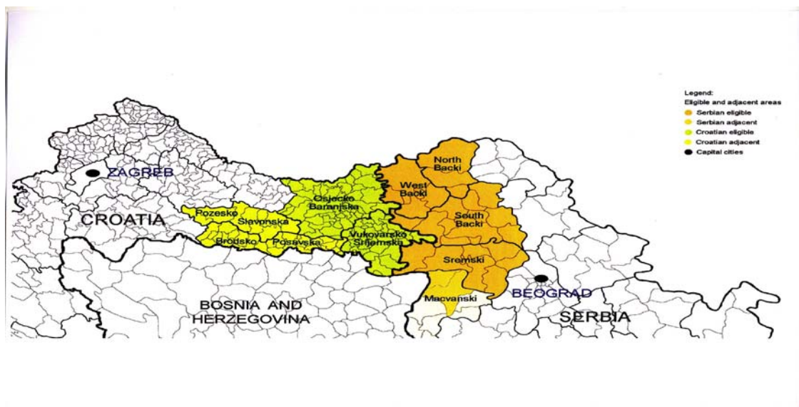
Slika 2. Prihvatljivo područje za provedbu projekata iz programa IPA Prekogranična suradnja Hrvatska-Srbija

Do sada je objavljen jedan natječaj/javni poziv za prikupljanje projektnih ideja koje mogu biti financirane sredstvima ovog Programa. Prema rezultatima istoga na području Osječko-baranjske županije od ukupno 11 odobrenih projekata njih se 9 u cijelosti ili djelomično odvijaju u našoj Županiji, a što iznosi 1.001.624 eura za područje Osječko-baranjske županije od ukupno mogućih 1.440.000,00 eura. Trenutno smo u iščekivanju raspisivanja drugog javnog poziva.