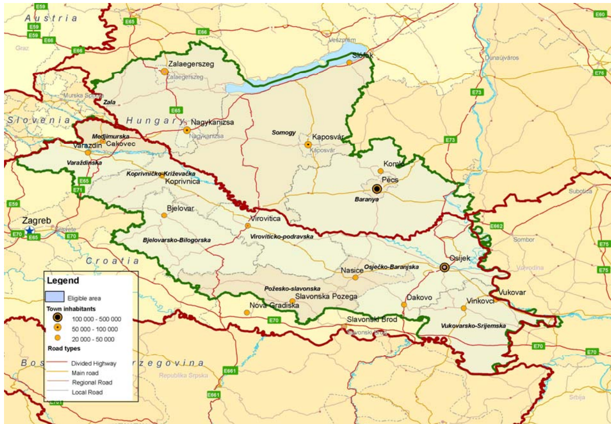
Slika 1. Prihvatljivo područje za provedbu projekata iz programa IPA Prekogranična suradnja Mađarska-Hrvatska

U okviru ovog Programa do sada su objavljena dva natječaja/javna poziva za prikupljanje projektnih ideja koje su mogle biti financirane sredstvima ovog Programa. Prema rezultatima prvog javnog poziva, 19 projekata u kojim sudjeluje 25 partnera odobreno je za područje Osječko-baranjske županije, a u ukupnoj vrijednosti od 2.656.794 eura.