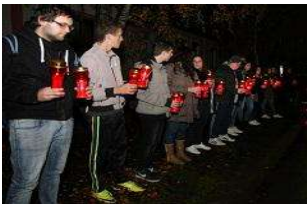
Slika 2. Obilježavanje Dana sjećanja na žrtvu Vukovara 4

U 2017. godini za realizaciju Programa sufinanciranja projekta obilježavanja Dana sjećanja na žrtvu Vukovara u osnovnim i srednjim školama u Proračunu Županije utrošeno je 19.550,00 kuna. Svijeće su se palile 17. studenoga 2017. godine duž Vukovarske ulice, prema rasporedu koji je dogovoren sa školama. Županija je osigurala sredstva za 4.600 lampiona koje su upalili učenici osječkih srednjih škola, a Grad Osijek je osigurao sredstva za isti broj lampiona koje su upalili učenici osnovnih škola s područja grada Osijeka. Ovim programom dostojanstveno smo se sjetili svih palih branitelja i civilnih žrtava, ali i Grada čija je žrtva u stvaranju slobodne i neovisne Hrvatske postala nacionalni simbol jedinstva i ponosa hrvatskog naroda.