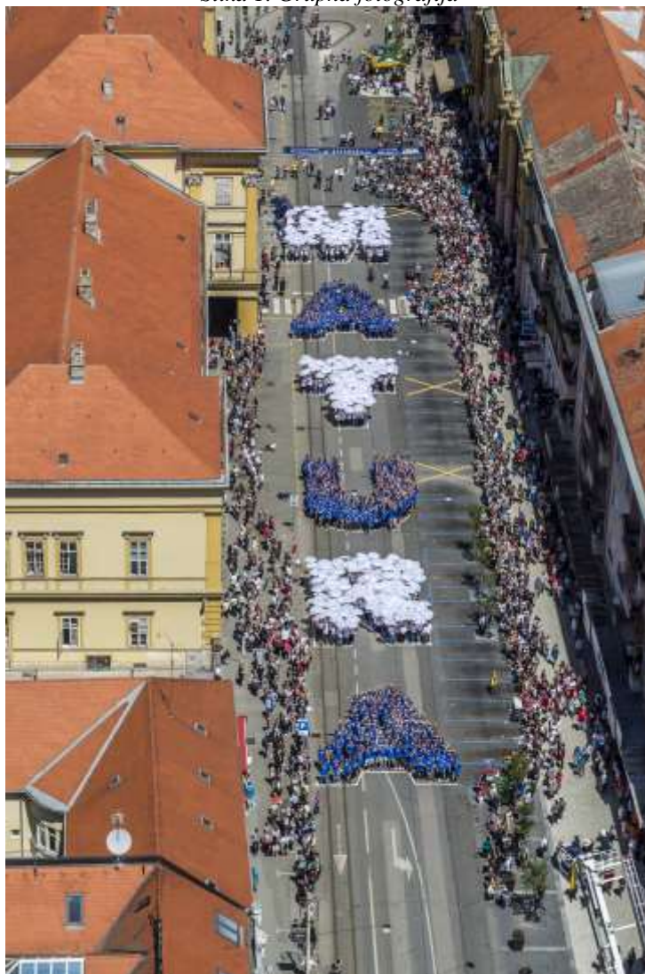
Slika 1. Grupna fotografija

Osječko-baranjska županija je osigurala sredstva u iznosu od 228.043,75 kuna za sve elemente ovoga projekta, kako za trošak obuke plesa, tehniku, oglašavanje i druge troškove, fotografiranje maturanata iz zraka, tako i za majice i kišobrane koji su maturantima ostali u trajnom vlasništvu kao uspomena na ovaj dan i jedinstveni projekt.